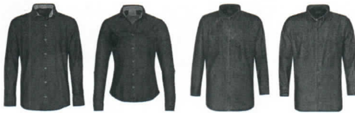
Mezclilla ultra ligera