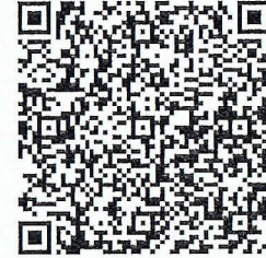
Efectos fiscales al pago

1.0[C50B20D6-0131-40A2-B1D2-3CAA8A0ABA64]20220616|mt63Gv3sRIAf6gOS+I8li24UUZjNPLXKe68Vb0l1txa1lp41F4vjvioeGpq3HvSjkF9VUPblyJexIFYOXQcNSLbAVUVfo4WLvdUc/uwsU6043J3HgBQlpDLLeJVzB0CIYQIEZOCEORw5EK6rViX1BQn9Pxm3o6TdNZXsNkJGVZ52Azy1O3NDVxEpREJaVj6eirubnFRjVyalgjpzOuD15wKl8AH/AZKo3A+wGf2RmkvlmswElpAmDxth5Buy9ublJnqx+N65sZ4V+V4gFwMLnasCatY4kspvN2XWTbBhzSHlu5GcgeOI4f4QQbTqiwBge1ffEqzTwzVfTikLzyWA==|00001000000412961981||