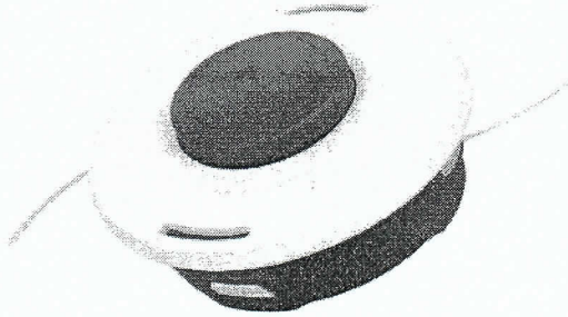
CABEZAL STIHL ORIGINAL AGOTADO

PRECIOS : NETOS CONDICIONES DE PAGO : CONTADO TIEMPO DE ENTREGA : INMEDIATA