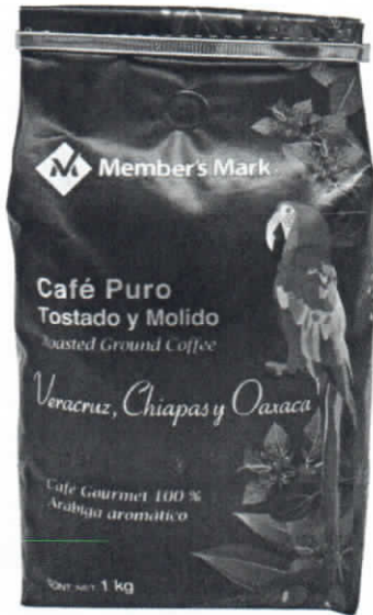
Daos al revisa antrms de ls lmanan nars anllcar srom