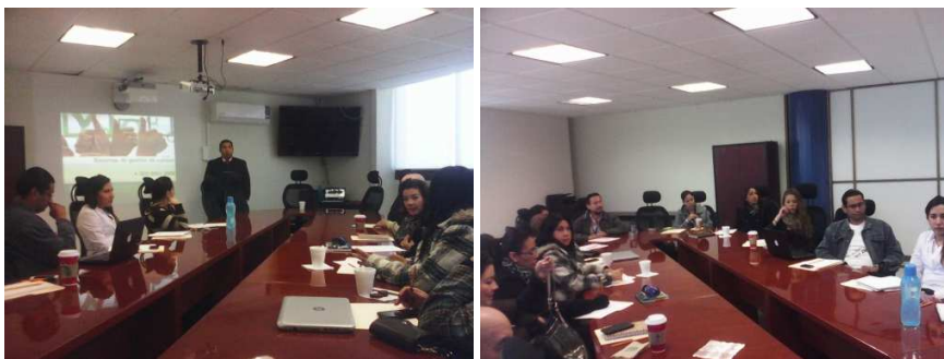
Curso de capacitación del Sistema de Gestión de Calidad 2014

En el marco del Programa de Fortalecimiento de la Calidad en las Instituciones (PROFOCIE) 2014, se impartió en el curso de Interpretación a la Norma: ISO-9001:2008 al personal administrativo y los profesores de Tiempo Completo, con el objetivo de Proporcionar a los participantes, las herramientas teóricas, para analizar e interpretar los requisitos de un Sistema de Gestión de Calidad de conformidad con la Norma: ISO-9001:2008 y correlacionar dichos requisitos con los procesos de su área de trabajo para su correcta aplicación.