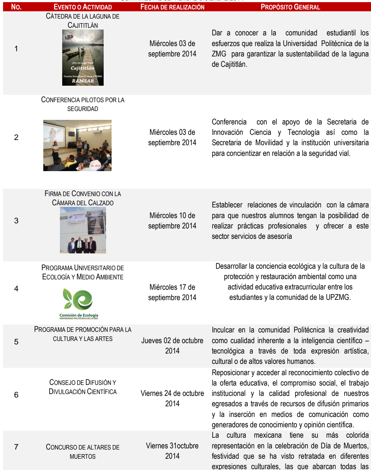
TABLA 12. ACTIVIDADES ACADÉMICAS, DE VINCULACIÓN, CULTURALES Y DEPORTIVAS UPZMG CUATRIMESTRE SEPTIEMBRE-DICIEMBRE 2014