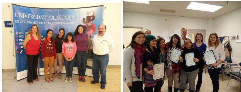
BECARIAS PROYECTA 100MIL, UPZMG