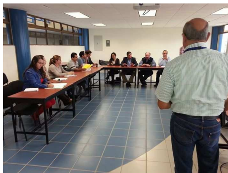
Clausura de la 4ta. Auditoría Interna del SGC

Como parte de las actividades de mejora continua del Sistema de Gestión de Calidad de la Universidad, durante el periodo septiembre-diciembre 2014 se llevó a cabo la cuarta auditoría interna programada, donde se encontraron áreas de oportunidad que están siendo atendidas por las áreas,