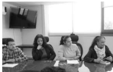
Reunión de cierre