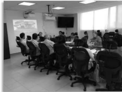
Curso de capacitación del Sistema de Gestión de Ambiental 2015

Como parte de las actividades para la implementación del Sistema de Gestión Integral, se impartió en el curso de Interpretación a la Norma: ISO-14000:2004 al personal administrativo y los profesores de Tiempo Completo, con el objetivo de proporcionar a los participantes, las herramientas teóricas, para analizar e interpretar los requisitos de un Sistema de Gestión Ambiental de conformidad con la Norma: ISO-14000:2004 y correlacionar dichos requisitos con los procesos de su área de trabajo para su correcta aplicación rumbo a la certificación.