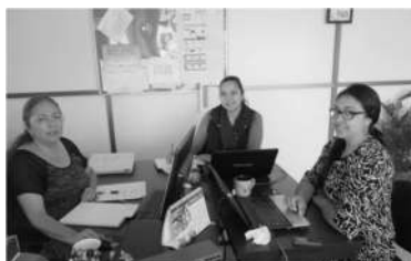
Séptima auditoría de seguimiento

Como parte de las actividades de mejora continua del Sistema de Gestión de Calidad de la Universidad, durante el periodo septiembre-diciembre 2015 se llevó a cabo la séptima auditoría interna, donde se encontraron áreas de oportunidad que están siendo atendidas por las áreas, a fin de mejorar los procesos internos. En esta auditoría participaron cuatro auditores internos y fueron revisados los procesos de: Enseñanza-Aprendizaje, Gestión de los Recursos, Vinculación con el Cliente, Control de Documentos y satisfacción con el cliente”