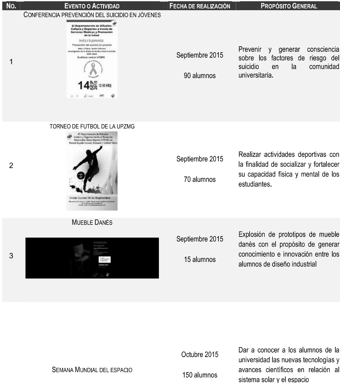
TABLA 4. ACTIVIDADES ACADÉMICAS, DE VINCULACIÓN, CULTURALES Y DEPORTIVAS UPZMG SEPTIEMBRE - DICIEMBRE 2015

Con la finalidad de fortalecer la Vinculación Institucional, y la formación integral de los estudiantes de la UPZMG, durante el cuatrimestre septiembre - diciembre 2015, se realizaron diversos eventos en materia de vinculación académica, actividades culturales, deportivas y de promoción a salud.