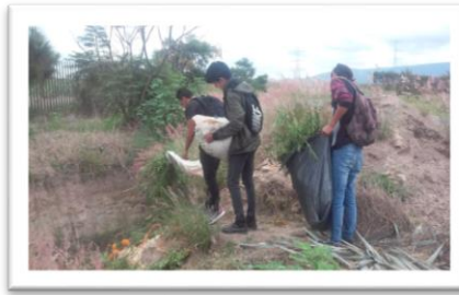
IMAGEN. COMPOSTEO UPZMG