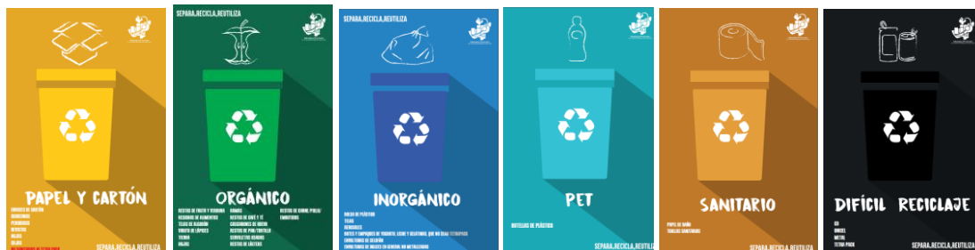
GRÁFICO. PROGRAMA PERMANENTE DE SEPARACIÓN DE RESIDUOS