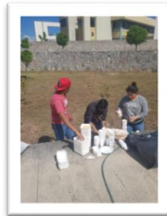
IMAGEN. RECICLADO DE UNICEL